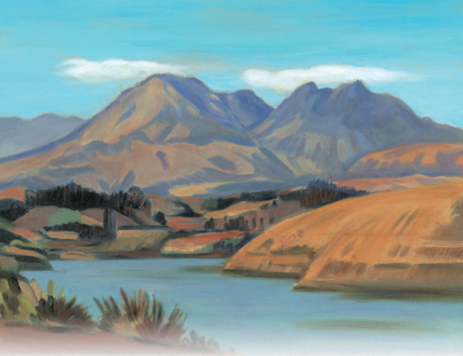
高田力蔵先生 作「長湯ダムの秋」